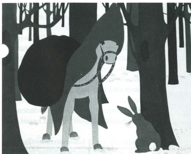
«Der dumme Nuck»

Vorführung der jüngsten Mitglieder der ATB Kunstradfahrer